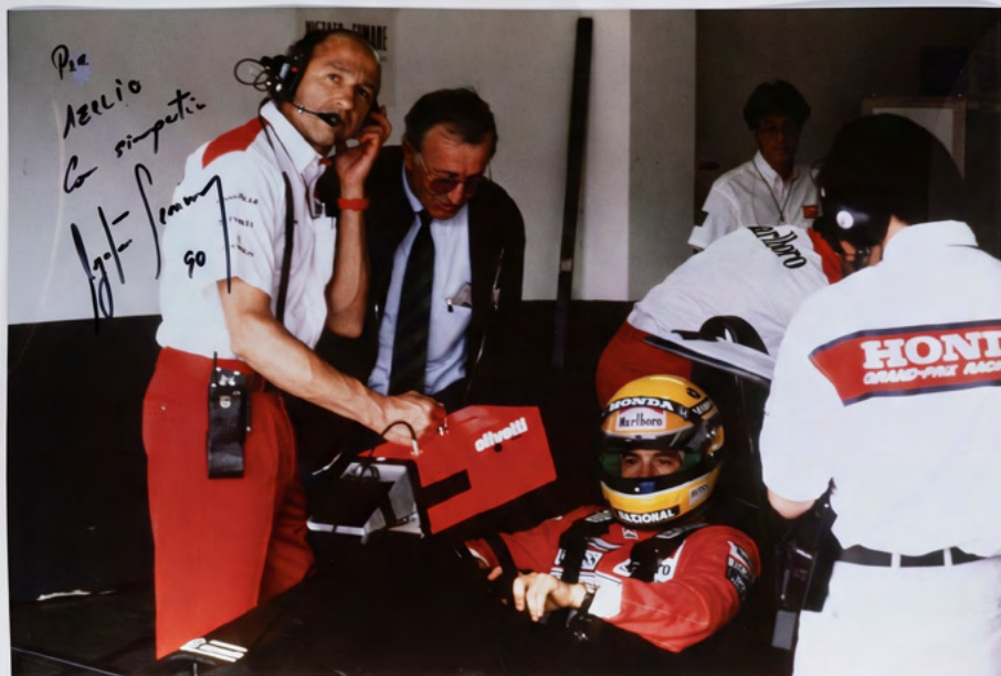
G.P. DI S. MARINO 1990