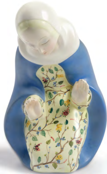
70 Lenci, Torino, 1930 ca

Figura di Madonna inginocchiata orante in terraglia a colaggio con decoro policromo. altezza cm 27. Firma e vecchia etichetta sulla base. Piccole sbecature