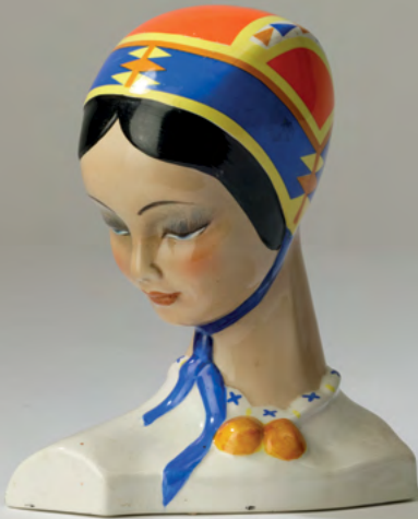
57 Alessandro Mola ESSEVI, Torino, 1930 ca

Testa di ragazza in costume sardo in terraglia a colaggio con decoro policromo. altezza cm 19,5