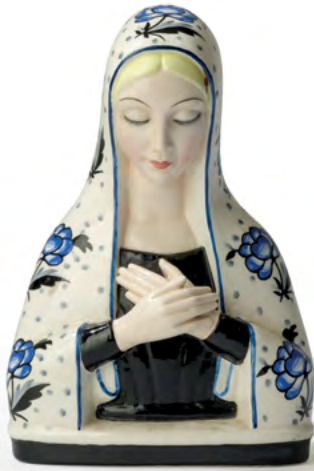
69 Lenci, Torino, 1930 ca

Busto di Madonna orante in terraglia a colaggio con decoro policromo. altezza cm 18,5. Marchio della manifattura