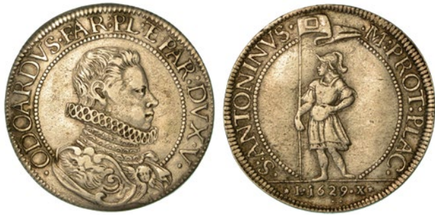
192 PIACENZA. ODOARDO FARNESE, 1622-1648.