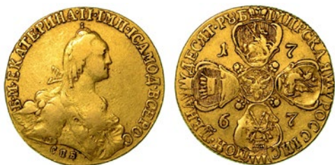
470 RUSSIA. KATERINA II, 1762-1796.

10 Rubli 1767, zecca di San Pietroburgo. Busto a d. R/ Stemma a croce. KM# 79a. Oro. g. 13,02. MB/BB Raro.