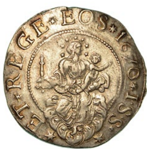
116 GENOVA. DOGI BIENNALI, 1528-1797.