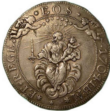
134 GENOVA. DOGI BIENNALI, 1528-1797.