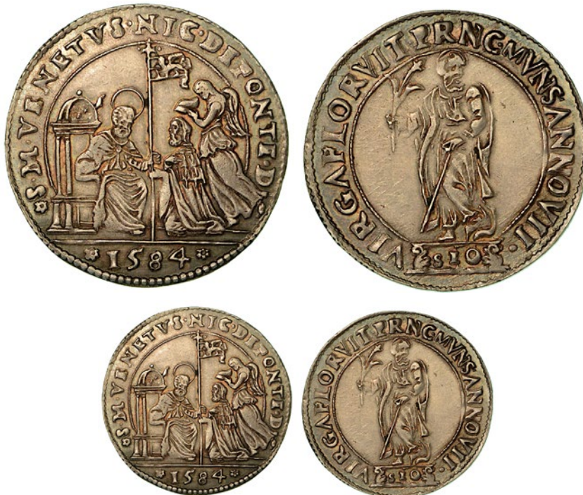
194 VENEZIA. NICOLÒ DA PONTE, 1578-1585.