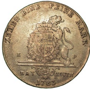
356 GERMANIA - BRANDEBURGO - BAYEREUTH. CHRISTIAN FRIEDRICH KARL ALEXANDER, 1757-1791.

Thaler 1783. Busto a d. R/ Stemma coronato e Leone. KM# 264. Arg. g. 27,77. B/MB Euro 60 - 80