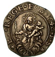
110 GENOVA. DOGI BIENNALI, 1528-1797.