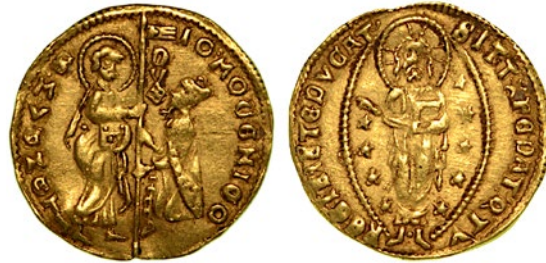
193 VENEZIA. GIOVANNI MOCENIGO, 1478-1485.