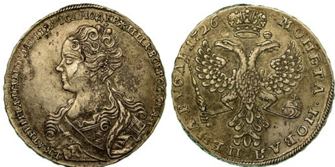
467 RUSSIA. KATERINA I, 1725-1727.