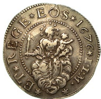
120 GENOVA. DOGI BIENNALI, 1528-1797.