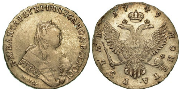
469 RUSSIA. ELIZAVETA I, 1741-1762.