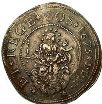
119 GENOVA. DOGI BIENNALI, 1528-1797.