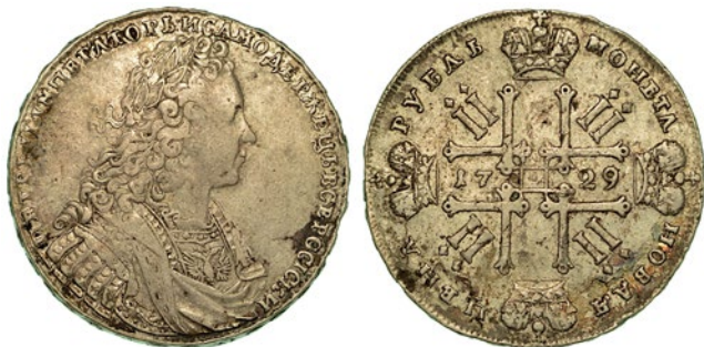
468 RUSSIA. PETR II, 1727-1730.

Rublo 1729. Busto a d. R/ Croce coronata. KM# 182.3. Arg. g. 28,03. MB/BB