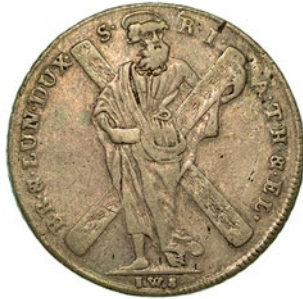
357 GERMANIA - BRAUNSCHWEIG - LÜNEBURG - CALEMBERG - HANNOVER. GEORG III, 1760-1820.