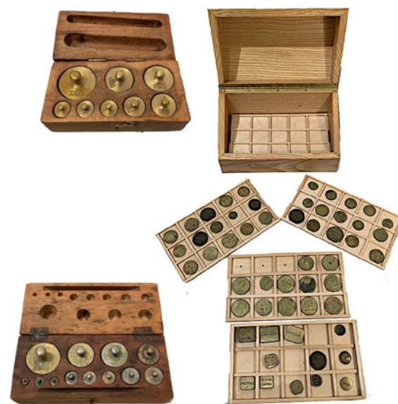
778 SET DIVARI ASTUCCI CON PESI DA BILANCIA, ALCUNI IN COFANETTO CON CASSETTINI.