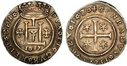
106 GENOVA. DOGI BIENNALI, 1528-1797.