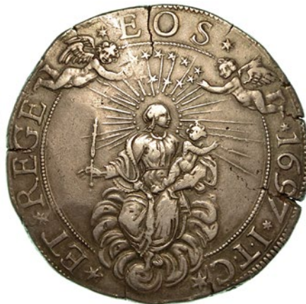
131 GENOVA. DOGI BIENNALI, 1528-1797.