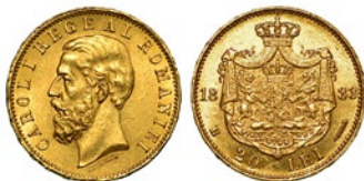
466 ROMANIA. CAROL I, 1866-1914.

20 Lei 1883, zecca di Bucarest. Testa a s. R/ Stemma coronato. Friedberg 3. Oro. g. 6,44. SPL