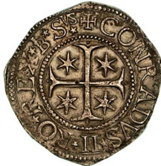
109 GENOVA. DOGI BIENNALI, 1528-1797.