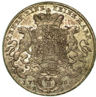
355 GERMANIA - BRANDEBURGO - BAYEREUTH. CHRISTIAN FRIEDRICH KARL ALEXANDER, 1757-1791.

Thaler 1766. Busto a d. R/ Stemma coronato. KM# 252. Arg. g. 28,06. q,SPL Euro 80 - 100