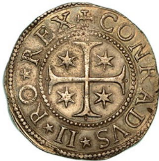
108 GENOVA. DOGI BIENNALI, 1528-1797.