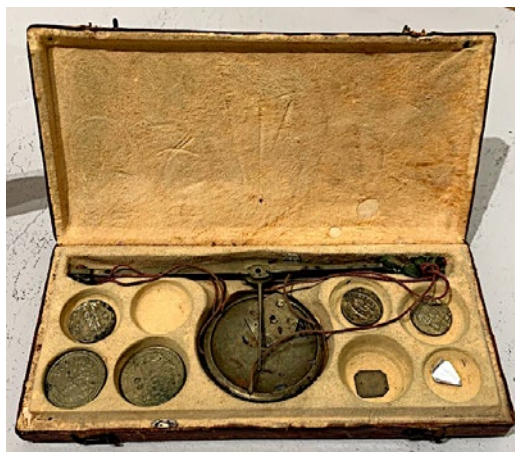
775 ASTUCCIO IN CUOIO CON BILANCINA SETTECENTESCA.

Misure astuccio, cm. 8x18. Qualche peso mancante. Condizioni discrete.