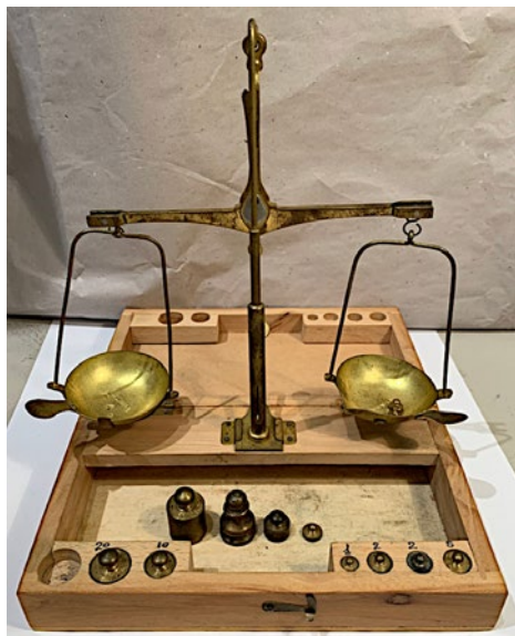
777 ASTUCCIO IN LEGNO CON BILANCIA OTTOCENTESCA.

Misure astuccio, cm. 11x20. Con pesi vari. Condizioni molto buone.