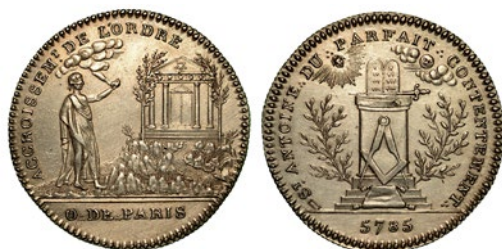
533 FRANCIA. ORIENS DE PARIS. SAINT ANTOINE DU PARFAIT CONTENTEMENT 5785 (1785).