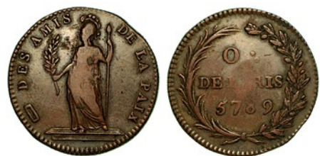
535 FRANCIA. ORIENS DE PARIS. DES AMIS DE LA PAIX 5789 (1789-1802).