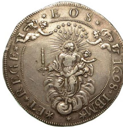
132 GENOVA. DOGI BIENNALI, 1528-1797.