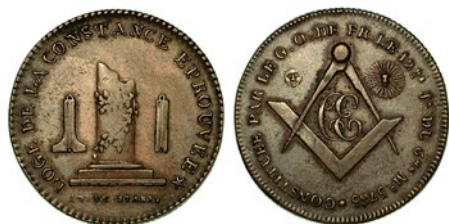
534 FRANCIA. ORIENS DE PARIS. LOGGIA DELLA CONSTANCE EPROUVEE, 5785 (PRIMA DEL 1812).