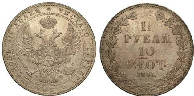
465 POLONIA. NICOLAS I, 1825-1855.

10 Zlotych 1841. Aquila bicipite coronata. R/ Valore e data entro corona. C# 134. Arg. g. 31,31. BB/SPL Raro. Con bustina Santamaria.