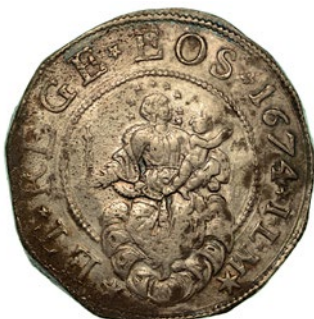
117 GENOVA. DOGI BIENNALI, 1528-1797.