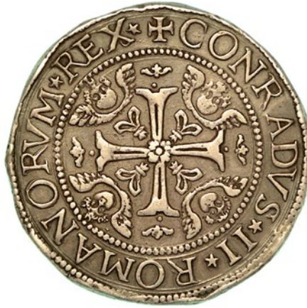
107 GENOVA. DOGI BIENNALI, 1528-1797.