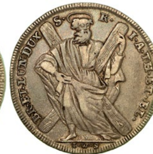
359 GERMANIA - BRAUNSCHWEIG - LÜNEBURG - CALEMBERG - HANNOVER. GEORG III, 1760-1820.

Thaler 1758. Stemma coronato. R/ S. Andrea. DAV. 2089. Arg. g. 29,15. q,BB Euro 100 - 120