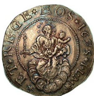
118 GENOVA. DOGI BIENNALI, 1528-1797.