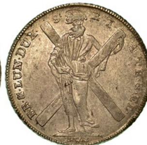
358 GERMANIA - BRAUNSCHWEIG - LÜNEBURG - CALEMBERG - HANNOVER. GEORG III, 1760-1820.

Thaler 1766. Stemma coronato. R/ S. Andrea. DAV. 2104. Arg. g. 29,04. q,SPL Piccolo colpo. Euro 180 - 200