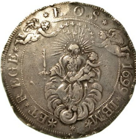
133 GENOVA. DOGI BIENNALI, 1528-1797.