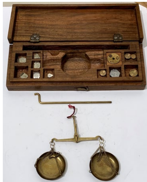
776 ASTUCCIO IN LEGNO CON BILANCIA.

Misure astuccio, cm. 8x22. Qualche peso mancante. Condizioni molto buone.