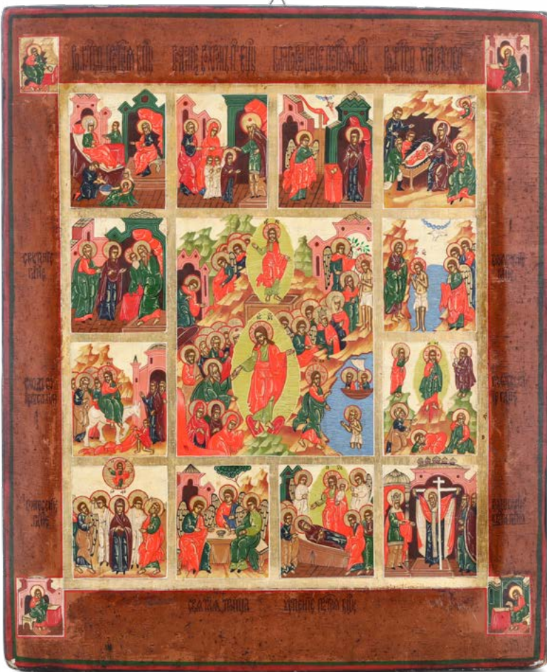
137 LA RESURREZIONE DI CRISTO E SCENE DELLA SANTA TRADIZIONE CRISTIANA ICONA A TEMPERA SU TAVOLA. RUSSIA XVIII-XIX SECOLO