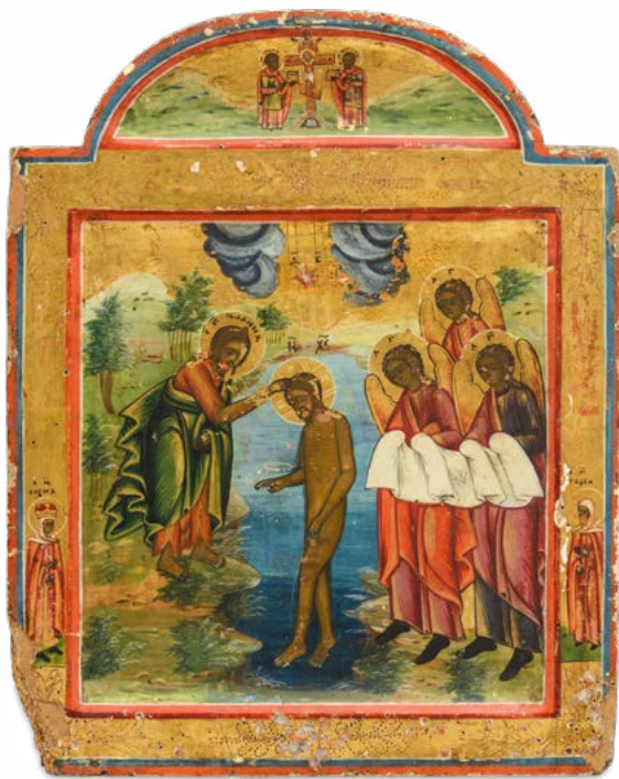
149 BATTESIMO DI CRISTO E DORMIZIONE DELLA VERGINE

SCUOLA BALCANICA DEL XIX SECOLO. ICONA SU TAVOLA