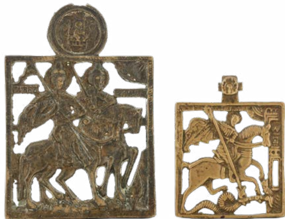
152 DUE PLACCHETTE TRAFORATE RAFFIGURANTI I SANTI BORIS E GLEB E SAN GIORGIO

BRONZO FUSO, TRAFORATO E CESELLATO. ARTE ORTODOSSA, RUSSIA XIX SECOLO