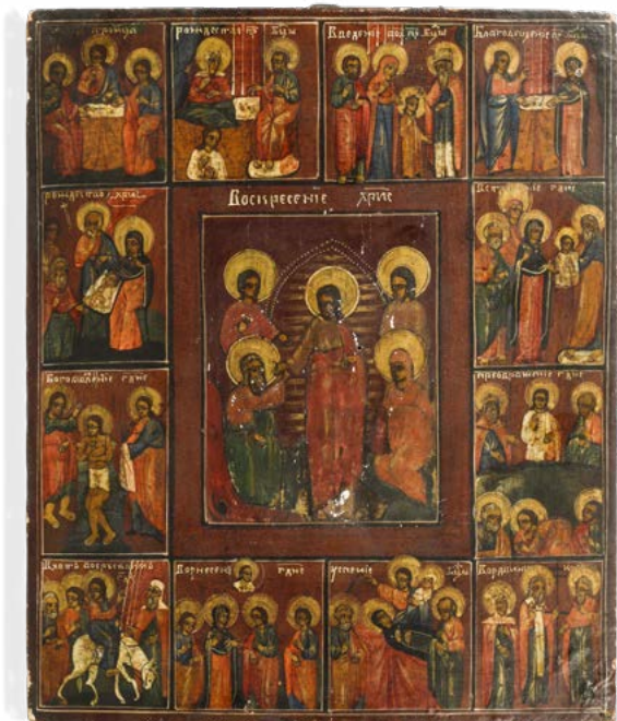
148 LA RESURREZIONE DI CRISTO (AL CENTRO) CON SCENE DEL VANGELO

ICONA AD OLIO SU TAVOLA. SCUOLA RUSSA DEL XIX SECOLO