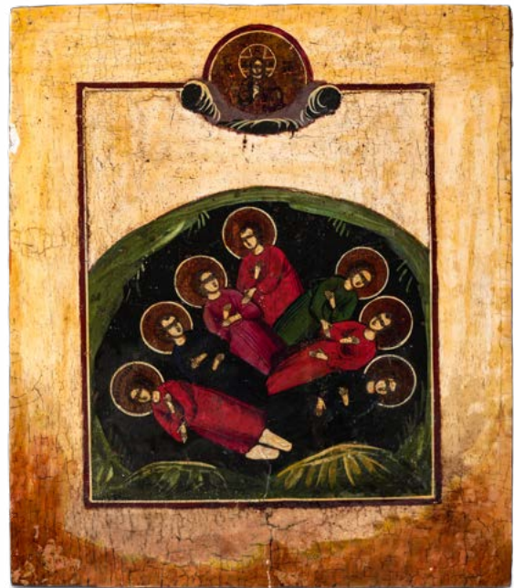
144 I SETTE DORMIENTI DI EFESO

ICONA AD OLIO SU TAVOLA SCUOLA RUSSA DEL XIX SECOLO