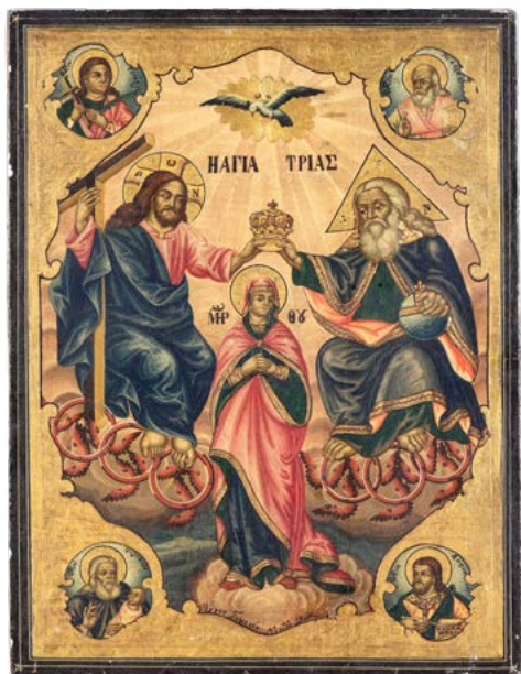
150 INCORONAZIONE DELLA VERGINE

ICONA A TEMPERA SU TAVOLA. GRECIA, XIX SECOLO