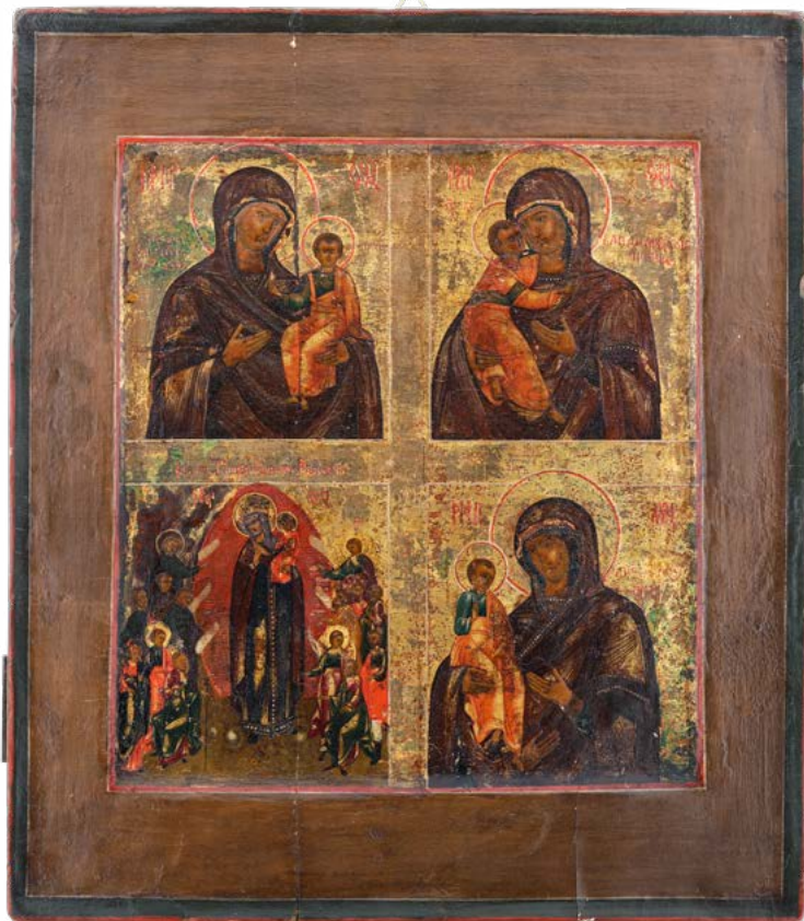
138 LA DEIPARA

ICONA QUADRIPARTITA A TEMPERA SU TAVOLA. RUSSIA XVIII-XIX SECOLO