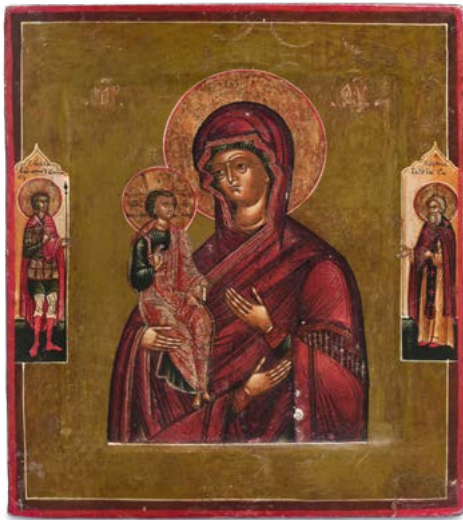
145 VERGINE DELLE TRE MANI

ICONA AD OLIO SU TAVOLA SCUOLA RUSSA DEL XIX SECOLO