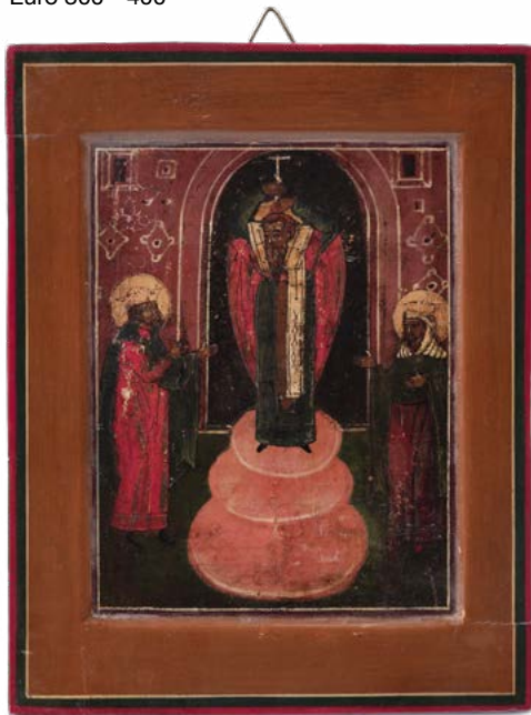
142 SAN BASILIO IL GRANDE

ICONA AD OLIO SU TAVOLA SCUOLA RUSSA DEL XIX SECOLO