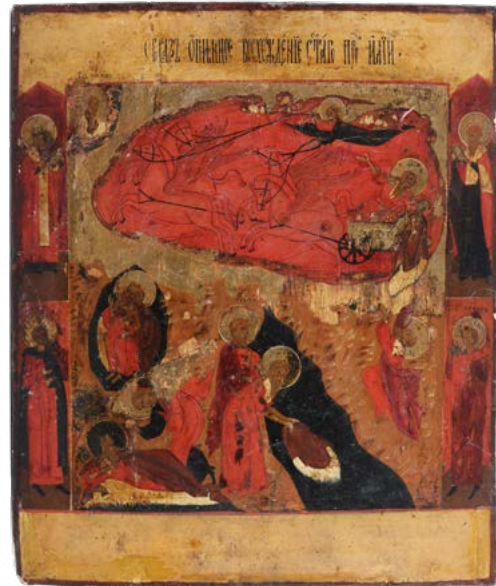
147 SCENE DELLA VITA DEL PROFETA ELIA

ICONA AD OLIO SU TAVOLA SCUOLA RUSSA DEL XIX-XX SECOLO