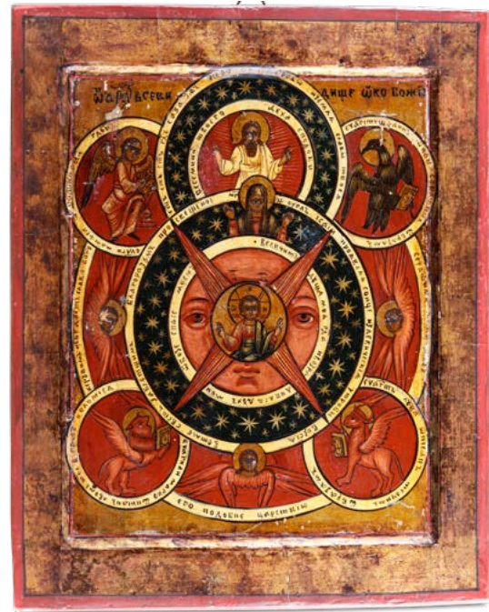
143 L'OCCHIO CHE VEDE TUTTO

ICONA A TEMPERA SU TAVOLA RUSSIA XVIII-XIX SECOLO