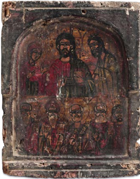
141 CRISTO PANTOCRATORE, LA VERGINE E SAN GIOVANNI BATTISTA CON SOTTOSTANTI I SANTI BASILIO IL GRANDE, SPIRIDON, NICOLA DI MYRRA, ALESSANDRO E GIOVANNI CHRYSOSTOMOS

ICONA AD OLIO SU TAVOLA SCUOLA BALCANICA DEL XIX SECOLO