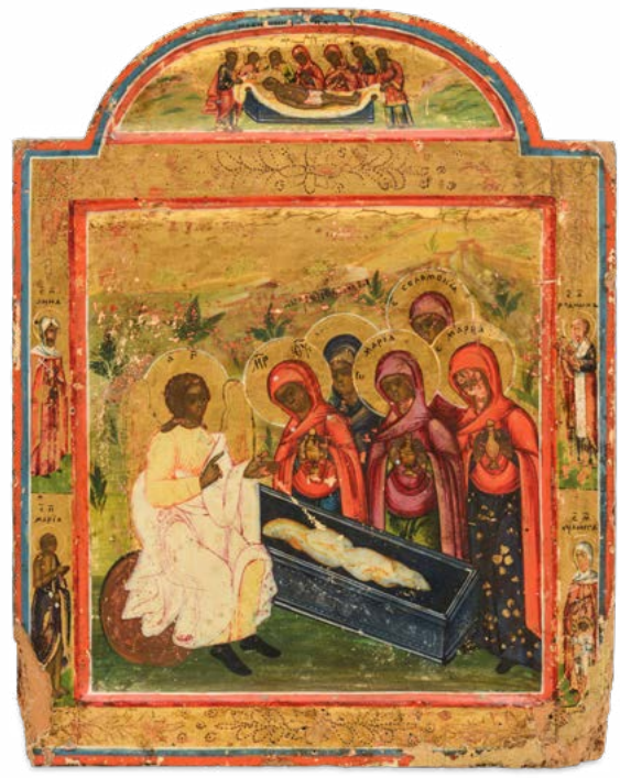
151 MIROFORE AL SANTO SEPOLCRO E SAN NICOLA

SCUOLA BALCANICA DEL XIX SECOLO. ICONA SU TAVOLA