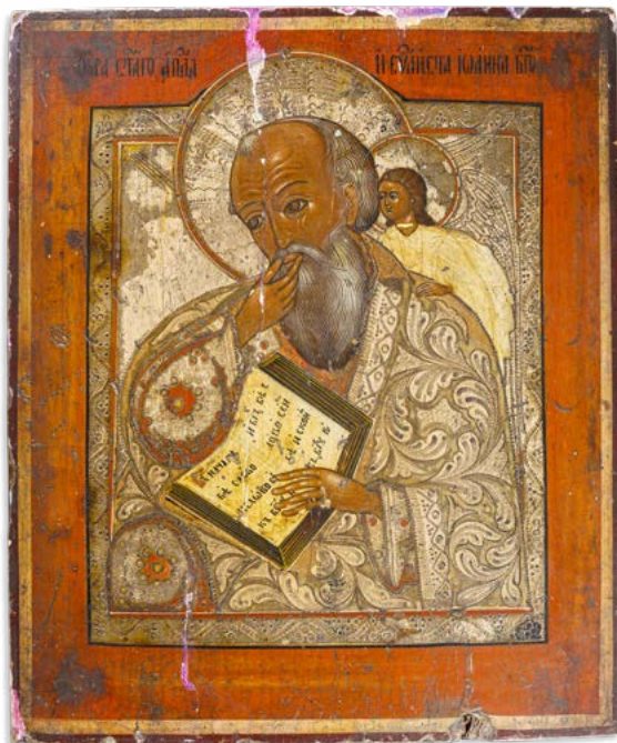
146 SAN GIOVANNI EVANGELISTA

ICONA AD OLIO SU TAVOLA SCUOLA RUSSA DEL XIX SECOLO