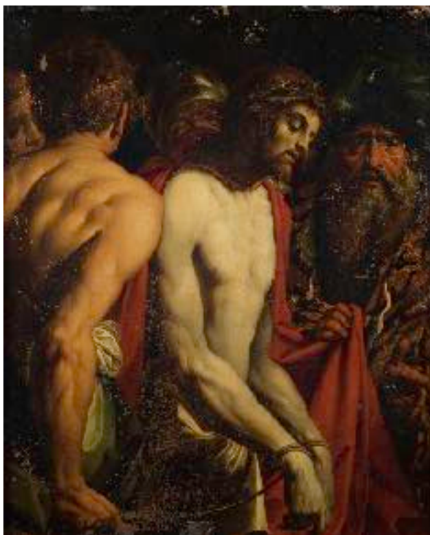
Abraham Janssens (1575-1632). Ecce Homo

Buoni risultati anche per la coppia di nature morte di un artista della cerchia di Jan Van Kessel (1626-1679), venduta a 30.000 euro, e per la coppia raffigurante un Santo Eremita e un Santo Vescovo di un autore appartenente alla cerchia di Bartolomeo di Giovanni (attivo 1488 - 1501), che è stata aggiudicata a 32.500 euro.