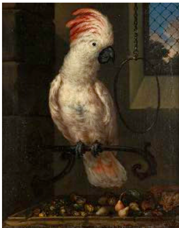
Bartolomeo Bimbi (1648-1729), attribuito a. Pappagallo sul trespolo

Dopo continui rilanci è stato aggiudicato l'importante dipinto raffigurante un pappagallo sul trespolo attribuito a Bartolomeo Bimbi (1648-1729), che rispetto alla stima di 6.000-7.000 euro ha raggiunto i 32.500 euro.